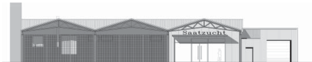
Südsicht aus Richtung des gemeinsamen Parkplatzes mit dem Pennymarkt

Ganz neu ist die Waschanlage für PKW und Kleintransporter. Sie befindet an der Ostseite des Gebäudes zur Alten Chaussee hin. Die Anlage ist für Fahrzeuge bis zu einer Waschhöhe von 2,60 Meter geeignet. Sie ist mit einem neu entwickelten Soft-Tec Material ausgestattet und setzt sich damit nennenswert von den bisherigen Waschanlagen ab, da sie einen äußerst lackschonenden Reinigungsvorgang garantiert. Die Tankstelle bleibt an Ort