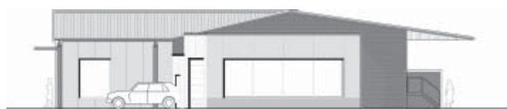
Ostansicht von der Alten Chaussee aus gesehen mit Blick auf die neue Auto-Waschanlage (Zeichnung: Schüch + Cassau)

Die einzelnen Warensortimente werden entsprechend der Kundennachfrage ausgerichtet. In Zukunft findet man ein breites Angebot an Garten- und Motorgeräten, Elektrowerkzeugen und Drahtwaren, Pflanzenschutz- und Düngemitteln, Saatgut und Erden sowie Spielwaren. Im Textilbereich wird hochwertige Arbeits- und Freizeitbekleidung und auch Reitsportbekleidung in