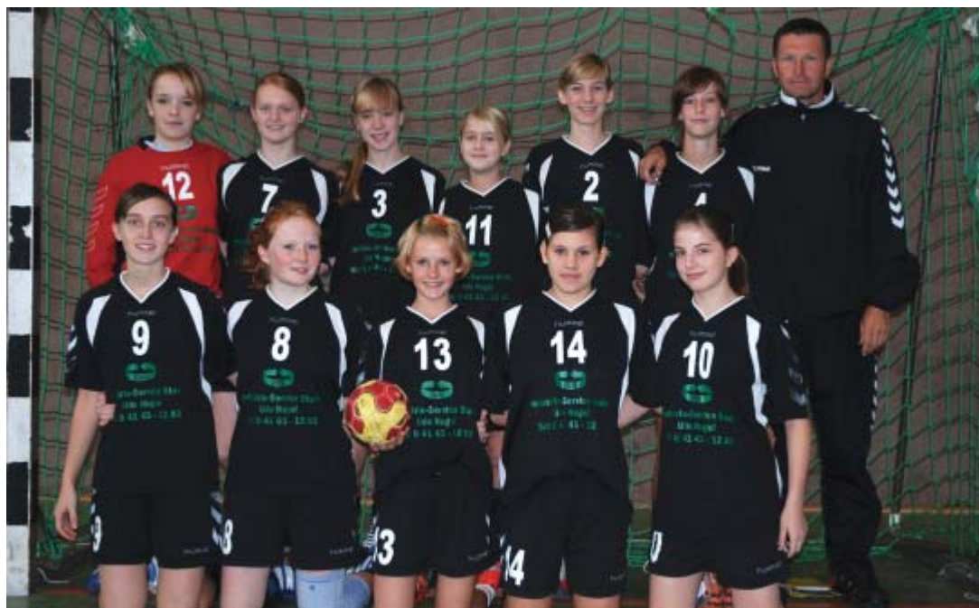
Für die weibliche Jugend C1 steht schon im Auswärtsspiel in Fredenbeck die vorzeitige Entscheidung über die Kreismeisterschaft an.

Das nächste Handball Blatt erscheint am 26.01.2008