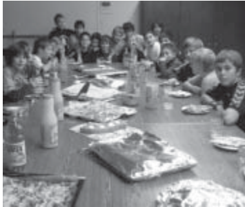
Zur Weihnachtsfeier der mJE gehören Pizza und Schoki-Suche

Die traditionelle Weihnachtsfeier der mJE1 fand in diesem Jahr am letzten Schultag des Jahres statt, entsprechend ausgelassen war die Stimmung. Nach dem beliebten „Puschen-Tennis“ wurde ein Bingo-Staffellauf durchgeführt, aber auch ein zünftiges Handballspiel durfte nicht fehlen. Die „alten Hasen“ unter den E-Spielern verausgabten sich jedoch nicht zu sehr, denn