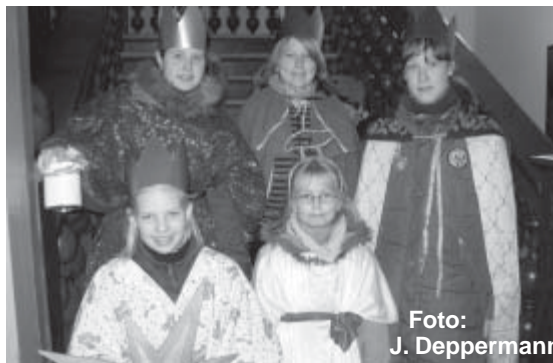
Die Heiligen Drei Könige hatten auch noch einen Sternenträger und als himmlische Verstärkung einen Engel dabei

Familien als Arbeitssklaven verkauft. Die Spenden werden benutzt, um diese Kinder freizukaufen und ihnen in Kinderheimen oder bei ihren Familien ein sicheres Zuhause und Schulbildung zu ermöglichen.