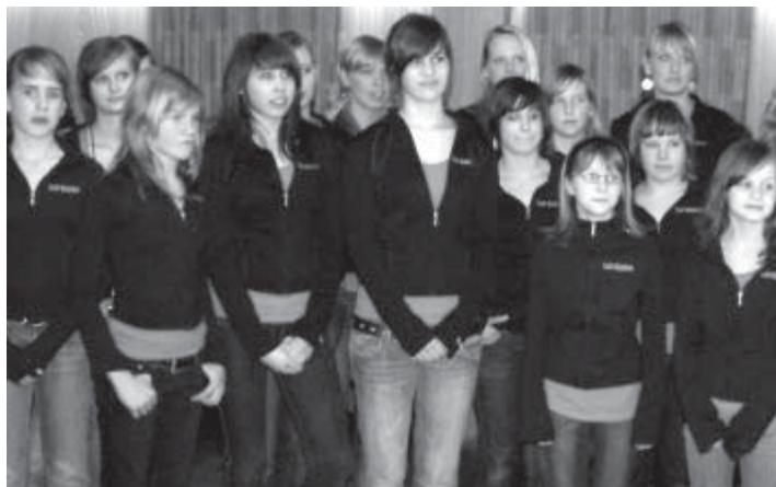
Die Showturngruppe Sweet Sixteen verkörpert das moderne Kunstturnen. Sie wurde die Mannschaft des Jahres 2008

schwund von etwa 16000 Euro. Vor allem die Anschaffung eines neuen, gebrauchten Busses als außerplanmäßige Ausgabe (14.5000 Euro) machte sich bemerkbar. Dafür gab es aber Rücklagen. Der